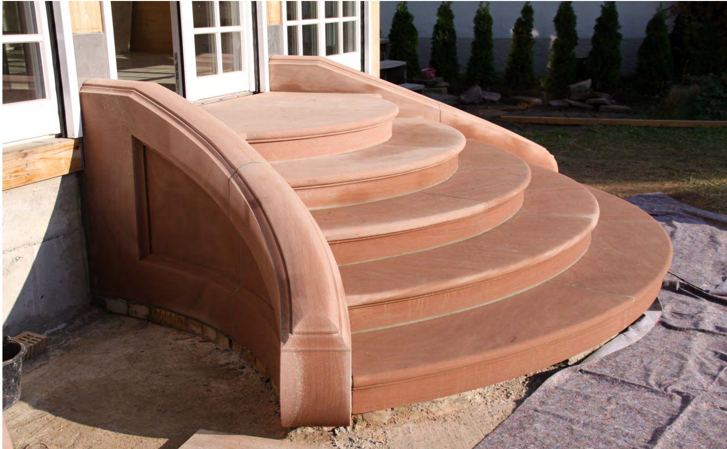
17. Fertige Treppenanlage