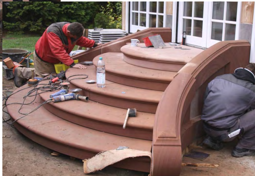
16. Nachkorrigieren / Nachschleifen der Treppenteile auf der Baustelle