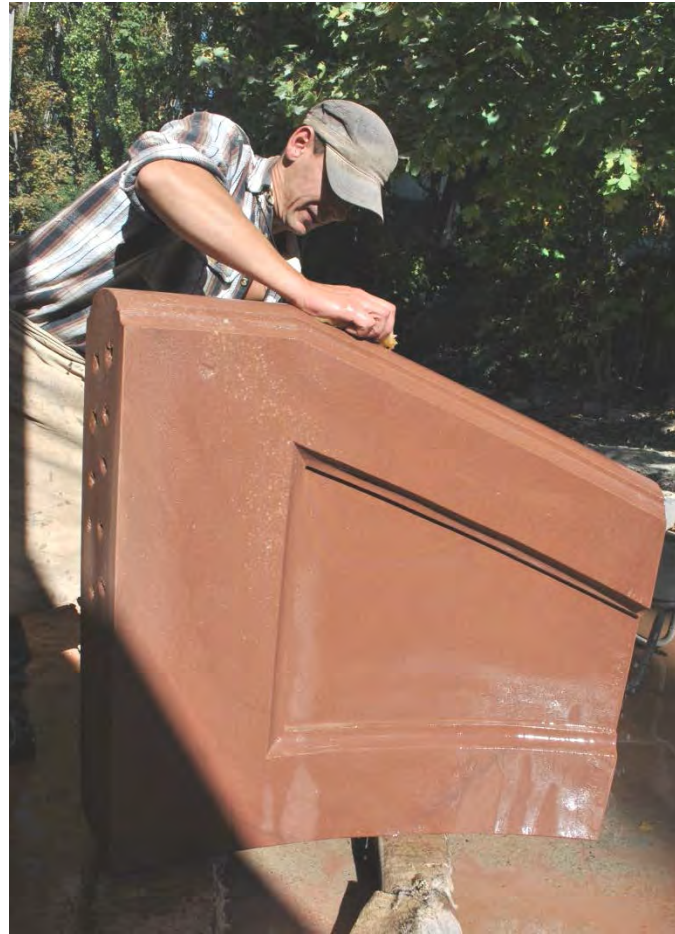
14. Nacharbeiten des Profils / gekrümmte Fläche