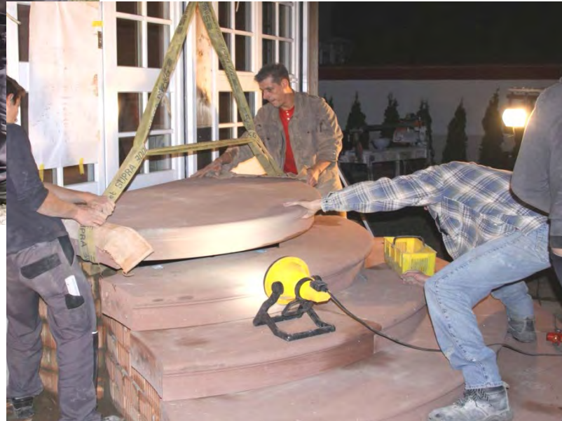
15. Aufbau / Versetzen der einzeln gefertigten Treppenteile