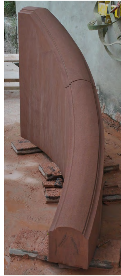
13. Bearbeiten Treppenwangenprofil mit Winkelschleifer, Knüpfel und Eisen