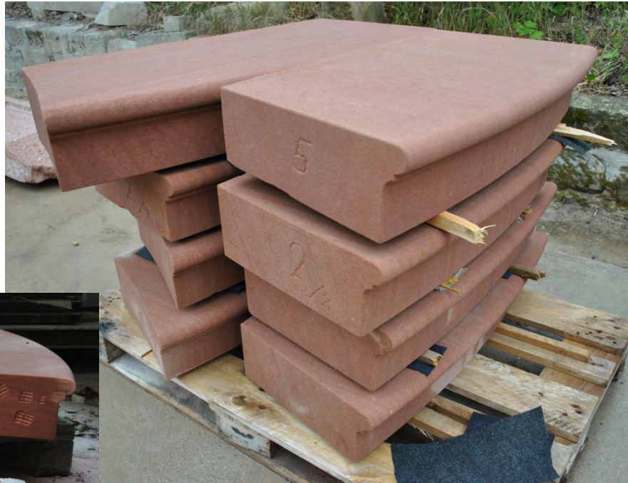
10. Endprodukt einzelner Treppenstufen mit Profil